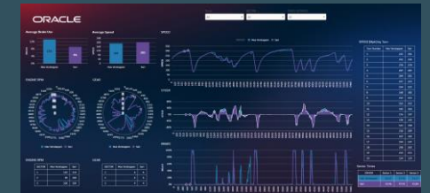
Verbesserung im Fahrstil sehen